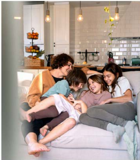
IKEA Sustainability Report FY24