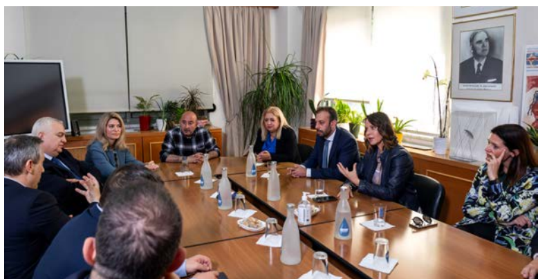
Στιγμιότυπο από τη συνάντηση που πραγματοποιήθηκε στο Δημαρχείο Τρικάλων για την ανακοίνωση υλοποίησης του αντιπλημμυρικού έργου στην πόλη.