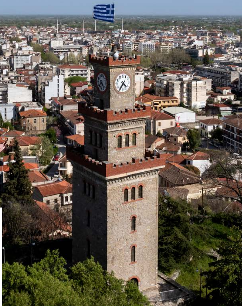
Η πόλη των Τρικάλων.

Με στοχευμένες πρωτοβουλίες ενίσχυσης των πληγέντων, έσπευσε να συνδράμει στην υποστήριξη της περιοχής από την πρώτη στιγμή. Μερικές από τις ενέργειες ανακούφισης, ήταν η δωρεά 2 εκατομμυρίων φιαλών νερού τα οποία μοιράστηκαν σε συνανθρώπους μας που είχαν άμεση ανάγκη. Παράλληλα, και με στόχο την άμεση ανακούφιση