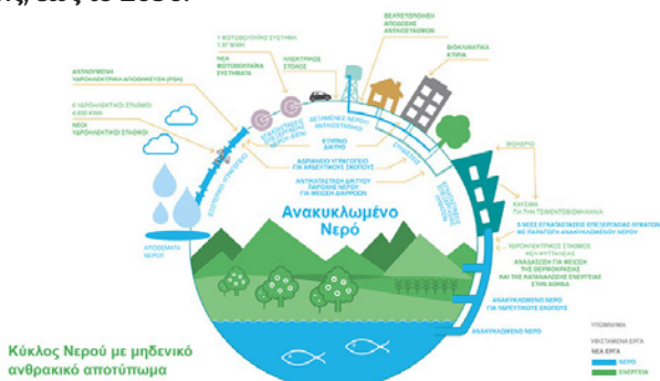
Κύκλος Νερού με μηδενικό ανθρακικό αποτύπωμα